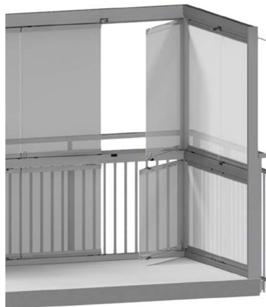
WINDOOR 410 SPLIT, RAMFRIA LUCKOR

Flexibelt viksystem med många kombinationsmöjligheter. Kan monteras antingen innanför befintligt balkongräcke eller på balkongräcket.