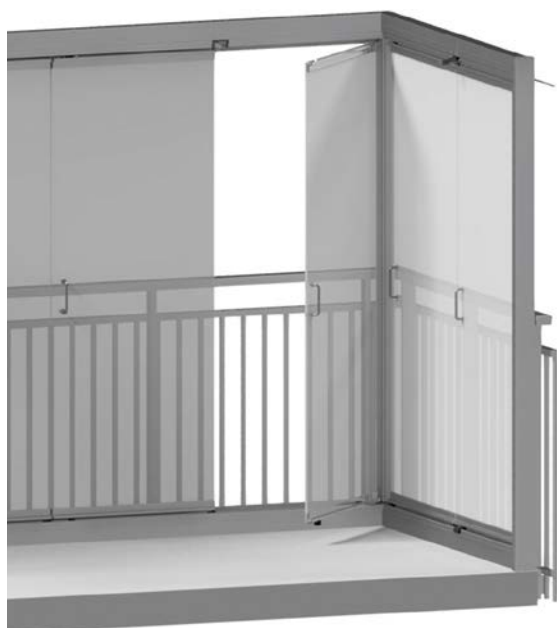
WINDOOR 410, RAMFRIA VÅNINGSHÖGA DÖRRAR

Windoor 410 är ett väderbeständigt och robust system med få rörliga delar. Det är i princip underhållsfritt med en frestande kombination av låg driftskostnad och lång livslängd. Och dörrarna är lätta att hantera tack vare slitstarka hjul och kullager i rostfritt stål. Sunparadise öppnar än en gång en ny möjlighet till ett friare uteliv i hemmet.