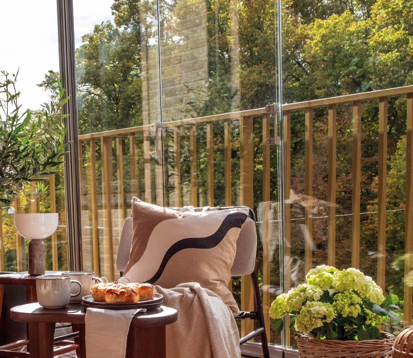
Windoor 410, ramfria våningshöga dörrar