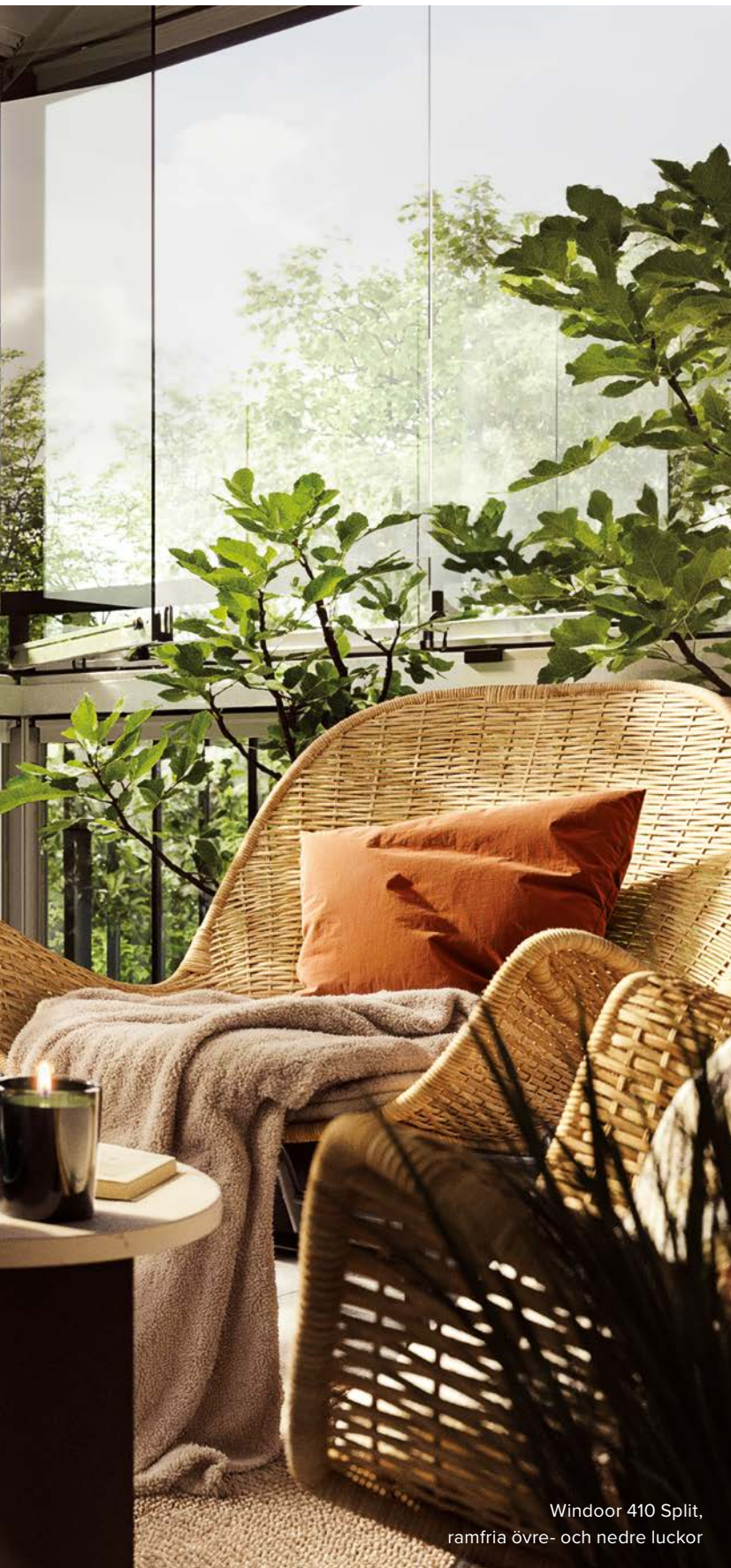
Windoer 410 Split, ramfria övre- och nedre luckor